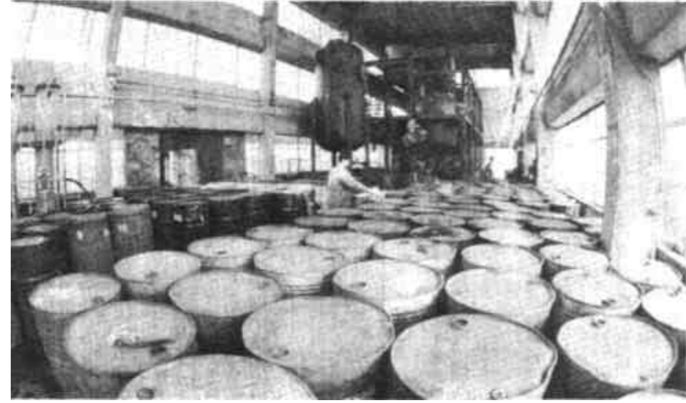
市石油化工设备厂振成化工实业公司积极开发研制新产品，已达到4个系列32个品种。图为生产车间一角。 本版责任编辑 黄功霖

广饶讯 广饶县西营乡党政干部在加快农村经济发展中，积极为农民出谋划策，帮助农民尽快致富，受到了群众欢迎。 去年十月份，这个乡进行了机构改革，对党政班子的主要领导进行了调整。新任的党委书记杜宝亭、乡长蒋振海，就制约本乡经济发展的因素进行了认真分析，并在党委扩大会议上谈了经济发展的具体措施。随后，党委、政府成员分头深入到村、到户体察民情。发现有部分农民致富步伐不快，经济意识淡薄，乡、村干部的服务工作也没有跟上。针对这种状况，乡党委、乡政府经常召集乡、村干部座谈，围绕“农民要致富，干部怎么办？”的主题展开讨论。确定加强服务，帮助农民加快致富步伐。为此，乡党委、政府把机关干部分成四个助民小组，实行主要领导包管区，一般干部包村的办法，深入村户，帮助农民出点子、想办法、找项目、定措施、因地制宜，发展经济。西营石村在驻村干部的帮助下，根据本村实际，去年新上冬暖式大棚60个，每个大棚已收入9000多元。今年，全乡已新建果树2500亩，落实冬暖式大棚面积达7000多亩。他们还积极引导农民到乡驻地从事第三产业。目前，全乡40多户农民在乡驻地搞经营。既增加了农民收入，又活跃了市场经济。(炳修 跃进 兴发)