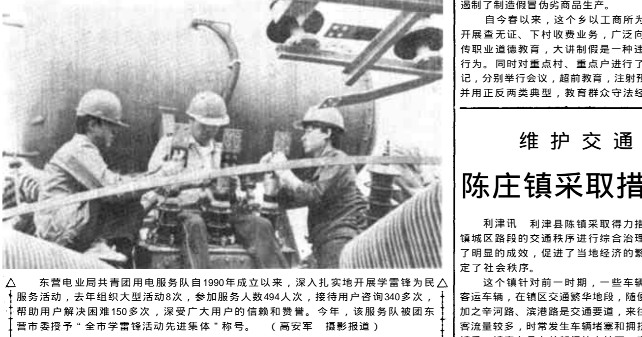
△ 东营电业局共青团用电服务队自1990年成立以来,深入扎实地开展学雷锋为民服务活动,去年组织大型活动8次,参加服务人员494人次,接待用户咨询340多次,帮助用户解决困难150多次,深受广大用户的信赖和赞誉。今年,该服务队被团东营市委授予“全市学雷锋活动先进集体”称号。

河口区总工会围绕中心抓大事,独立自主抓大事,围绕中心抓大事,独立自主抓大事,围绕中心抓大事,独立自主抓大事。