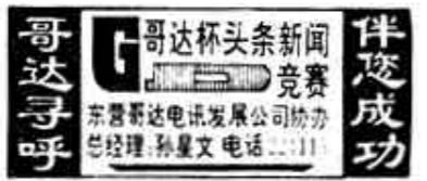
哥达寻呼 哥达杯头条新闻竞赛

本报讯 以土地后备资源丰富著称于国内外的我市，最近六年开发荒碱地130万亩。 我市现有耕地500多万亩，还有600多万亩正在沉睡，荒碱地开发潜力巨大。从1988年开始，国家先后在这里实施了黄河三角洲农业综合开发和黄淮海平原农业开发，还把黄河三角洲列为全国八大商品粮生产基地，作为重点建设工程重点开发。我市把农业开发尤其是荒碱地开发，作为提高农业综合经济效益的重要措施、加速实施开发黄河三角洲跨世纪工程的强大力量、实现社会主义农业现代化的必由之路，发扬自力更生、艰苦奋斗的精神，紧紧抓住农业开发的大好机遇，抓住水利这个“牛鼻子”，认真做好土地这篇大文章。我市采取统一规划、因地制宜、政策引导、资金扶持、集体开垦、承包到户等办法，动员千军万马，投入了以引黄河水种稻、开荒植棉、建设和改良草场为主要内容的荒碱地开发。六年来，共开发种植水稻47.5万亩，平均亩产450公斤，累计新增粮食75.38万吨。这里生产的“黄河大米”由于光照充足、生长期长、粒大透明、味美香口，成为稻谷族中的上乘佳品，被国家农业部命名为无公害的“绿色食品”。六年来，开荒植棉38万亩，平均亩产皮棉65公斤，累计新增棉花6.45万吨。生产的棉花出口到日本、泰国、韩国、墨西哥等六个国家和地区，每年出口约15万担。六年来，共改良草场11.2万亩，封育草场50万亩，新增肉类3.4万吨，蛋类2175吨，使黄河三角洲出现了“芳草萋萋、牛羊遍地”的塞外景象。就连荷兰和德国的奶牛、澳大利亚的美利努羊、加拿大的银狐，以及美国、独联体等国家的优良畜禽也在这里繁衍生息。 与此同时，我市还改造中低产田59万亩，成片造林2.1万亩，科技开发41万亩。总之，六年来，我市农业开发总投资规模累计4亿多元，1993年与开发前的1987年相比，农业总产值达到19.24亿元，增长52.3%；粮食总产量达到84.6万吨，增长70.5%，增长幅度居全省榜首；农民人均纯收入达到850元，增长369元；农业劳动生产率达到3484元，增长近一倍。农产品商品率达到71%，增加14个百分点。事实说明，农业开发是提高农业经济效益、推进农村小康进程的有效途径。(本报记者)